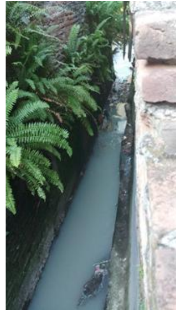
Gambar 1b. Sungai di Lokasi Pengabdian