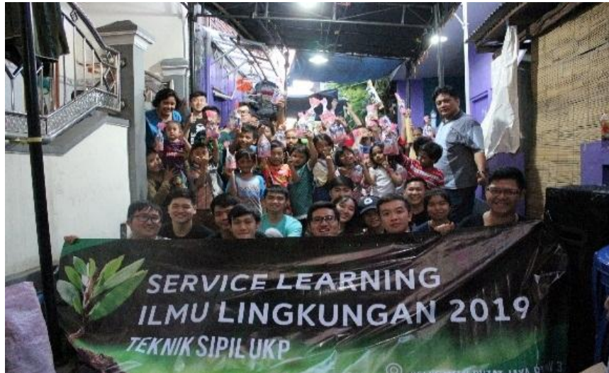
Gambar 4. Foto bersama dengan warga Putat Jaya

kegiatan serta acara ramah tamah yang disambut dengan baik oleh warga Kelurahan Putat Jaya. Kegiatan ini menunjukkan bahwa terjadi jalinan silaturahmi yang baik antara mahasiswa dan warga (lihat Gambar 4).