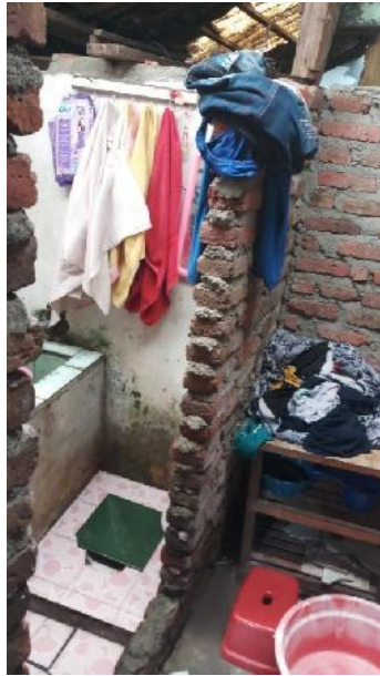
Gambar 1a. Survei Lokasi: Toilet Tanpa Septik Tank