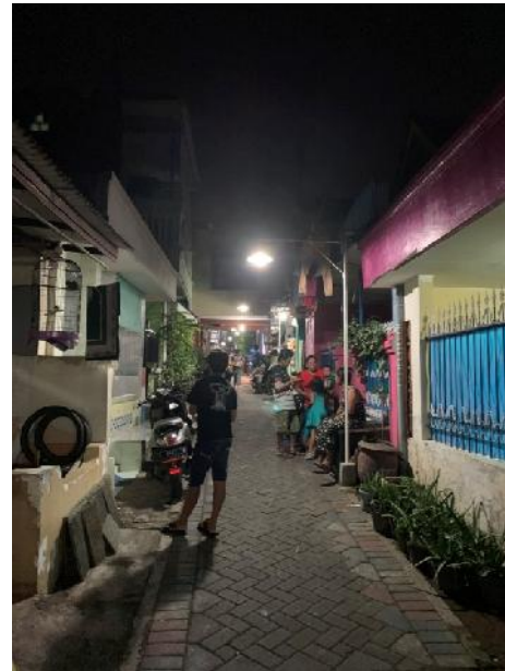
Gambar 1d. Lokasi Service Learning