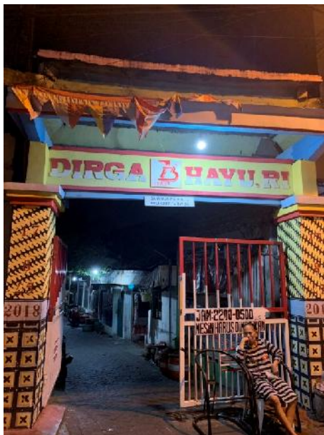
Gambar 1c. Gang Masuk Lokasi Kegiatan