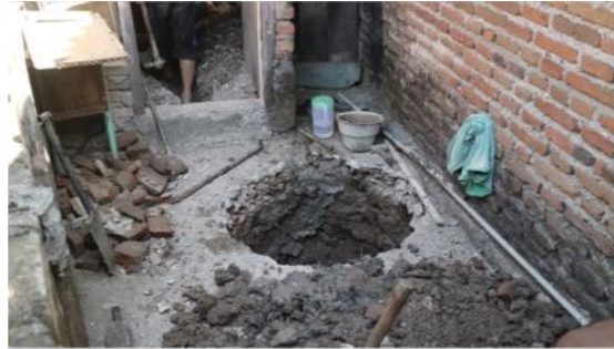
Gambar 2. Penggalian Lubang untuk Pemasangan Septic Tank

Pada tahap pelaksanaan yang dimulai pada tanggal 25 Mei 2019, kamar mandi yang sudah dimiliki warga dibongkar. Kemudian, dibuat dua lubang untuk bak kontrol dan septic tank kurang lebih sedalam tiga meter (lihat Gambar 2). Selanjutnya, dilakukan penggalian pipa untuk penyaluran kotoran buangan dari WC. Setelah pipa dipasang, dilakukan pengecoran di sekitar septic tank .