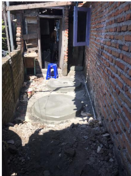
Gambar 5. Hasil pembuatan Septic Tank