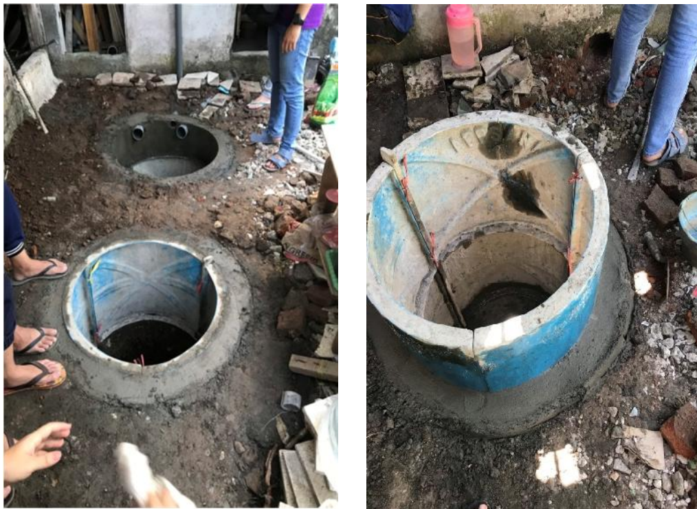
Gambar 3. Pemasangan Septic Tank