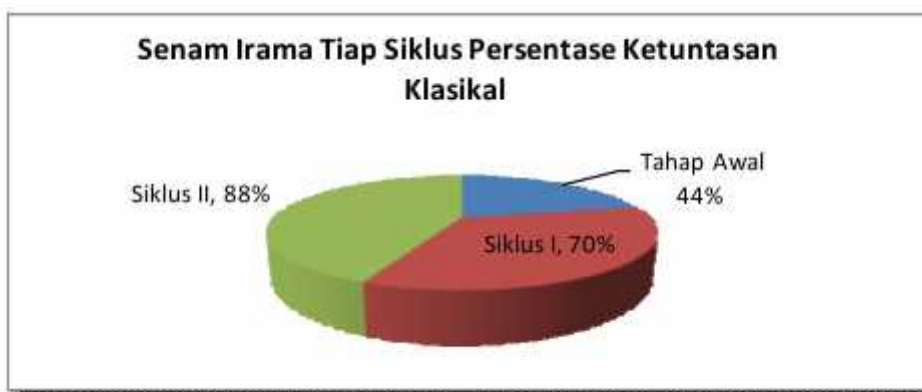
Diagram Persentase ketuntasan klasikal