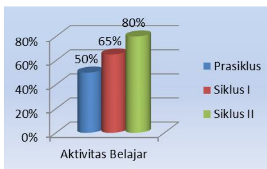
Gambar 2. Perbandingan aktivitas belajar prasiklus, siklus I dan II